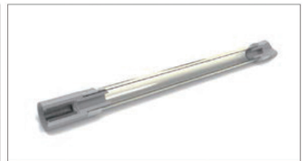
<미생체흡수성 약물 전달 캡슐>