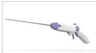
<미세침습 척추 협착증 치료기기>