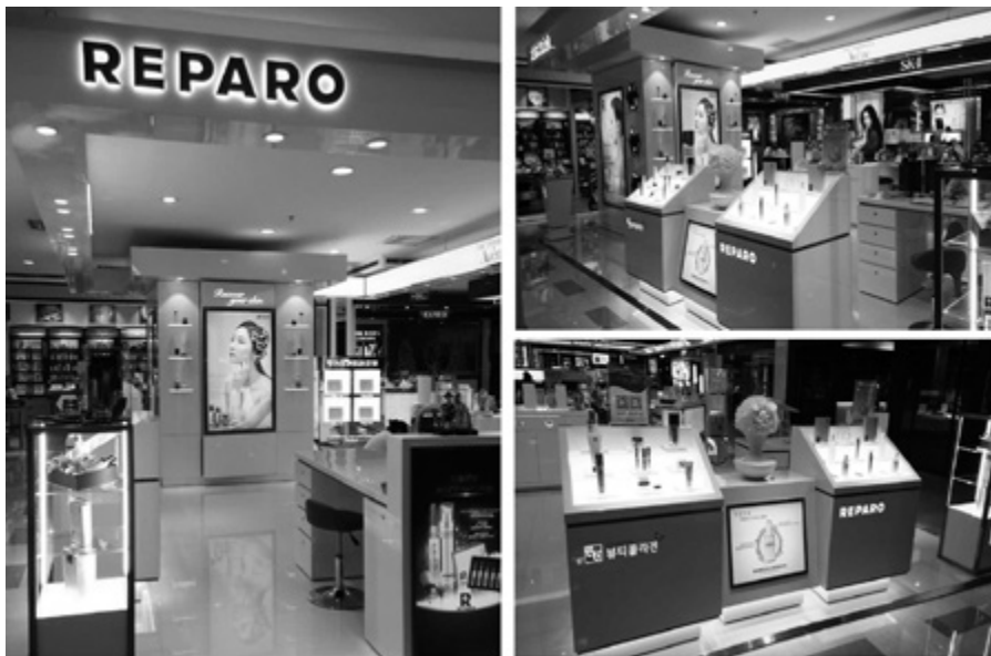
▲ 백화점 사진

중국의 생물과학기술 산업체인 바이오 마크社와 합작하여 의료 전문 브랜드인 레파로(REPARO)를 런칭하였다. 레파로는 남들보다 더 까다롭고, 높은 기준으로 질 높은 제품을 위해 끊임없는 연구를 하였다. 이는 입증된 임상 결과를 통해 보다 더 전문적인 제품으로 건강하고 아름다운 피부의 탄생을 돕고 있다.